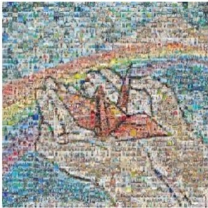
完成したモザイクアート

ピースサインが写った写真が全国から1259枚集まりました。集まった写真で平和を願うモザイクアートが完成しました。ご参加ありがとうございました。