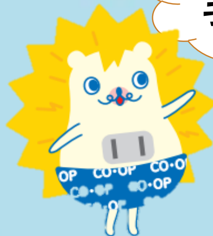
コープでんきキャラクター「こぶでん」