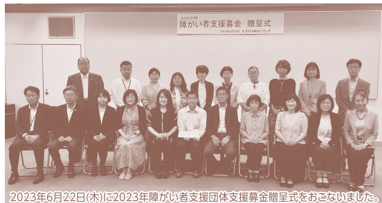
2023年6月22日(木)に2023年障がい者支援団体支援募金贈呈式をおこないました。

物価高や感染症など、いつもよりさらに厳しい状況が続いています。今年も署名や募金へのご協力よろしくお祈いします。