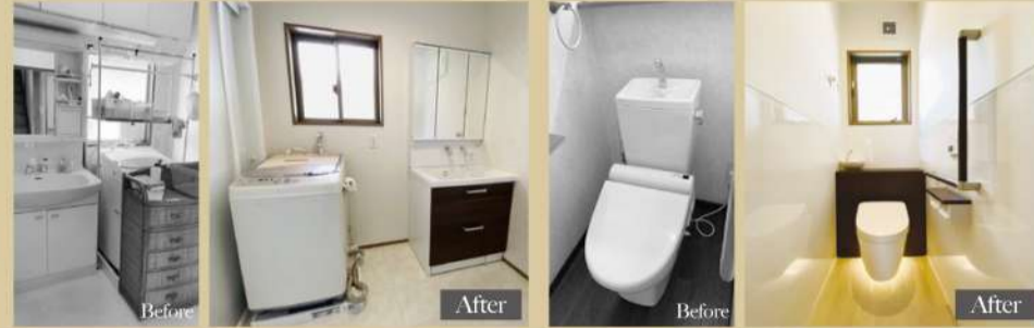
洗面所は以前と比べてスッキリとした空間に。入って右側には白地のタイル調のアクセントクロスが。トイレは掃除やお手入れがしやすいようにスッキリとしたデザインのものを選択。高級感のある空間となりました。