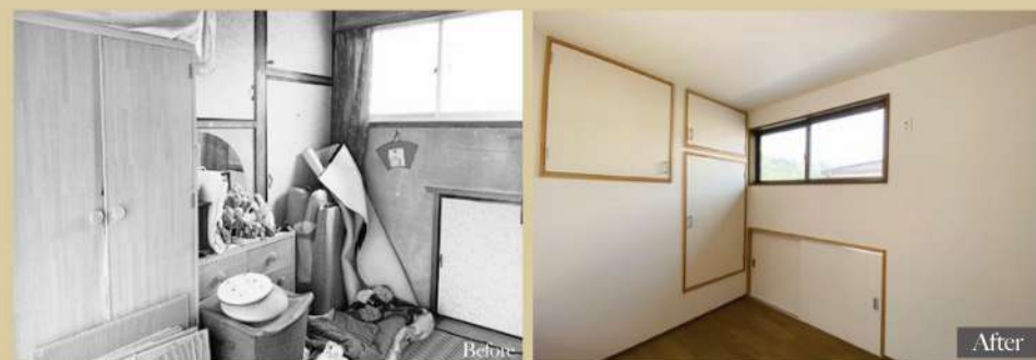
2階の和室はフローリングにして洋室に。元々あった建具も部屋の雰囲気に合わせて洋風のものに。