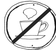
お茶はお気持ちだけで ご遠慮させていただきます