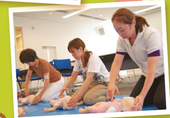
心肺蘇生の方法 後援：コープ共済連