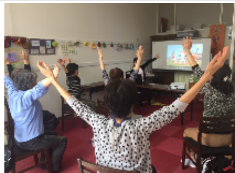
【寄ってこ～家の様子】

12月から「いきいき百歳体操」をはじめます。 毎週、13時半を目途にスタートします。 この機会に健康づくりのひとつとして はじめてみませんか？