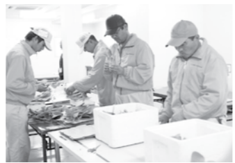
出荷作業も大切な仕事です