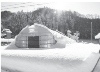
冬は、たいへんな雪が積ります