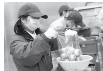
社員みんなで協力します