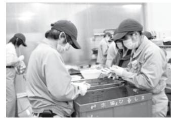
一つひとつ丁寧にチェックされます

(株)ハートコープひろしまの主な業務は組合員に届ける農産品の品質検査やパッケージなど。たまねぎやじゃがいも、グレープフルーツなどを一つひとつ、キズやかびがないか目で見て確認しています。当初仕事は、生協ひろしまからの依頼のみでしたが、社員たちの丁寧な仕事ぶりが評価され、生協ひろしまのお取引先様からも検品や包装の委託を受けるようになりました。