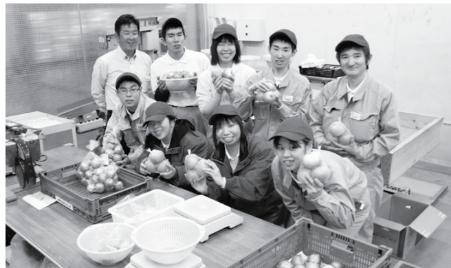
(株)ハートコープひろしま

地域と社会に貢献する取り組みとして、障害者雇用も積極的にすすめています。雇用の受け皿として特例子会社と農業生産法人を設立。3月末現在、両社あわせて16名の仲間と一緒に汗を流しています。