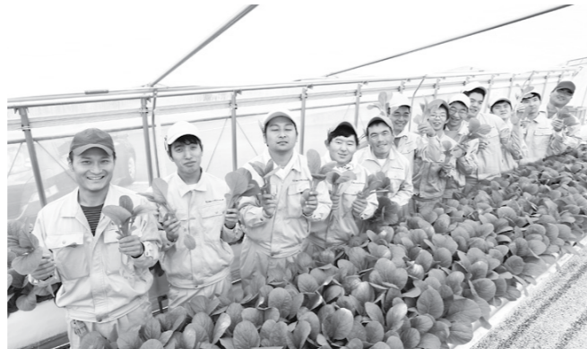
(株)ハートランドひろしま