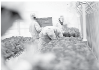
仲間同士の助けあいが大切です