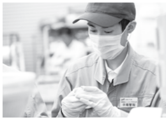
クレームゼロを目指す目です