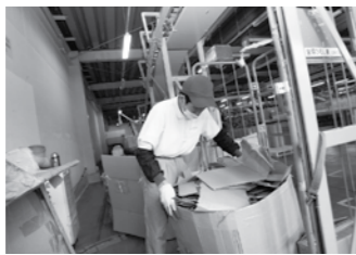
商品センターのダンボールリサイクルも受託